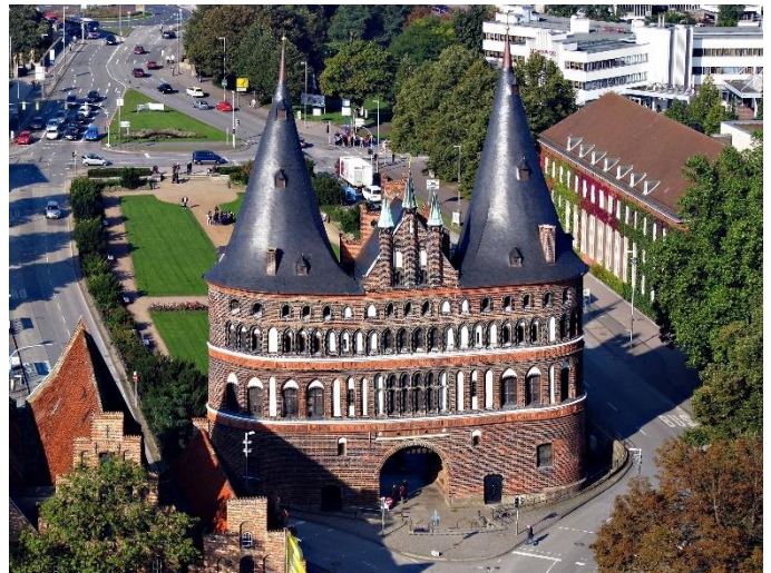
Kuvissa Lyypekin keskusta